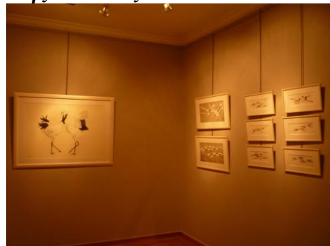
Ζωγραφική “Sumi” της κ. Ντίνας Αναστασιάδου